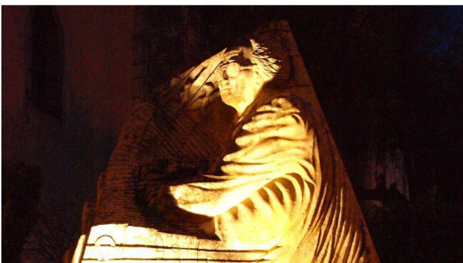
Denkmal für Olivier Messiaen in Neuvy-sur-Barangeon

1935 schrieb der tiefgläubige Komponist und Organist Olivier Messiaen mehrere Orgel-Meditationen über das Wunder von Christi Geburt: "La Nativité du Seigneur". Die Aufnahme mit Olivier Messiaen selbst als Interpreten entstand 1956 in Paris.