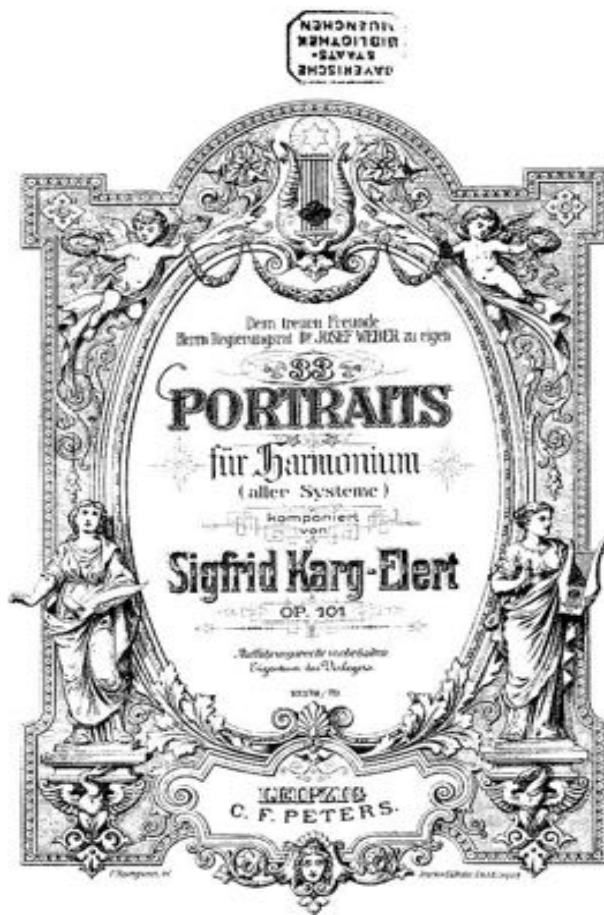
Abbildung 13 : Titelblatt 33 Porträts 53

– – 33 Portraits für Harmonium, Op.101.(besonders Nr.2 Crucifixus) 52 – (Es gibt eine Ausgabe für „Harmonium aller Systeme“)