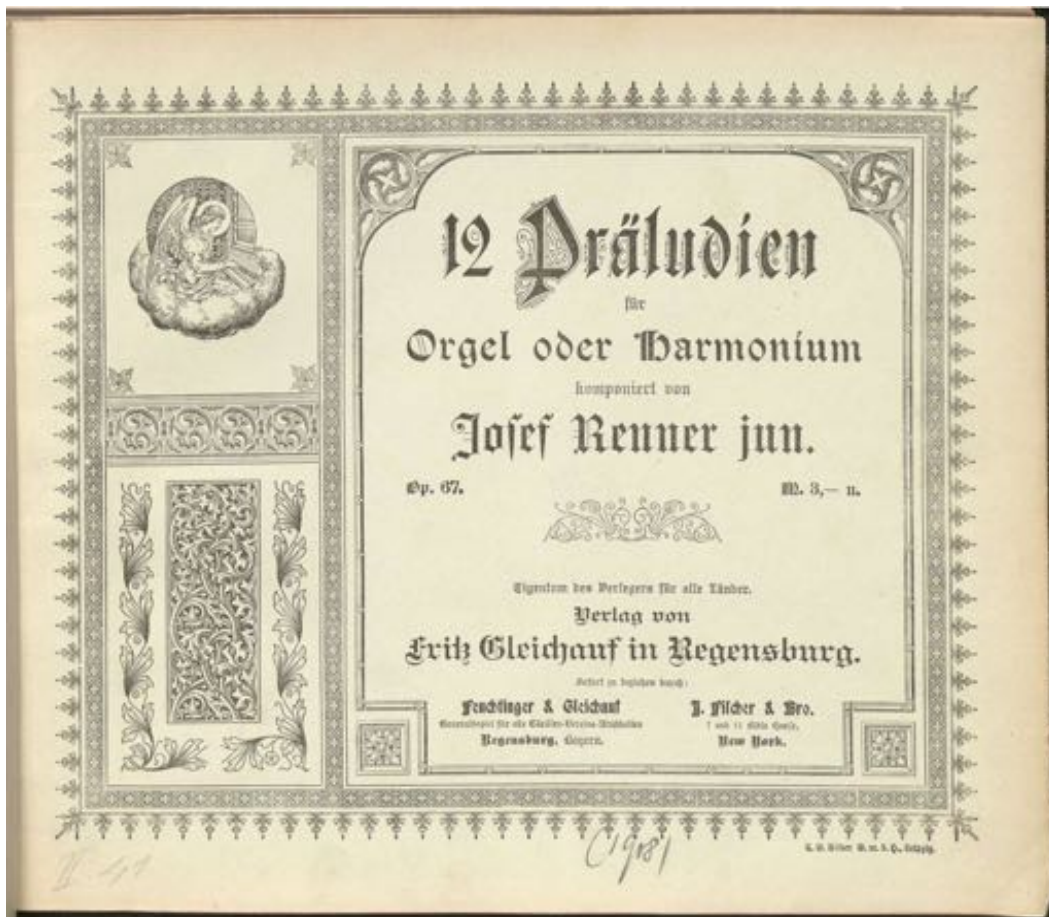
Abbildung 6: Titelseite 12 Präludien für Orgel oder Harmonium