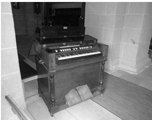
Abbildung 2: Harmonium in der Basilika Ilbenstadt

Bisweilen wurde das Harmonium auch zusätzlich zur Orgel als „Chorinstrument“ genutzt – wie hier in einer Kirche im Wetteraukreis.