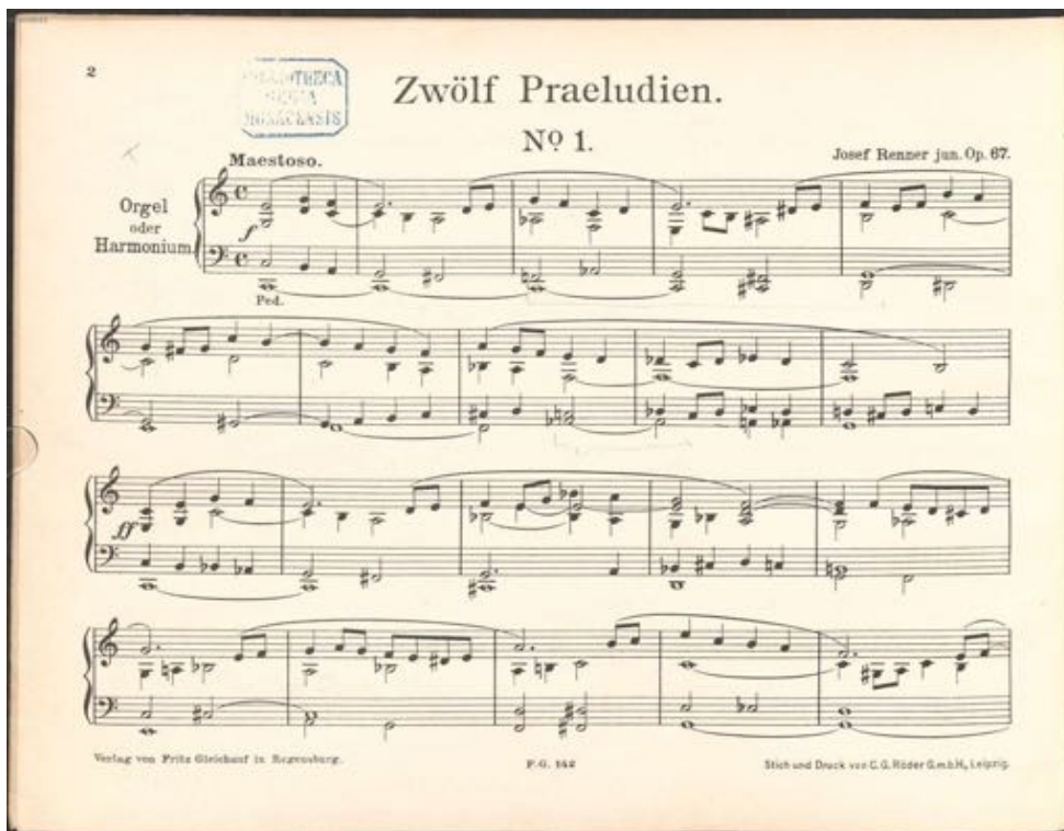
Abbildung 7: Noten 12 Praeludien 35

Diese Sammlungen verdienen eine (Wieder-)Entdeckung für die Verwendung in Gottesdiensten. Sie haben in ihrer spätromantischen Gestaltung einen ganz eigenen Charakter, der uns auch heute (wieder) bereichern kann.