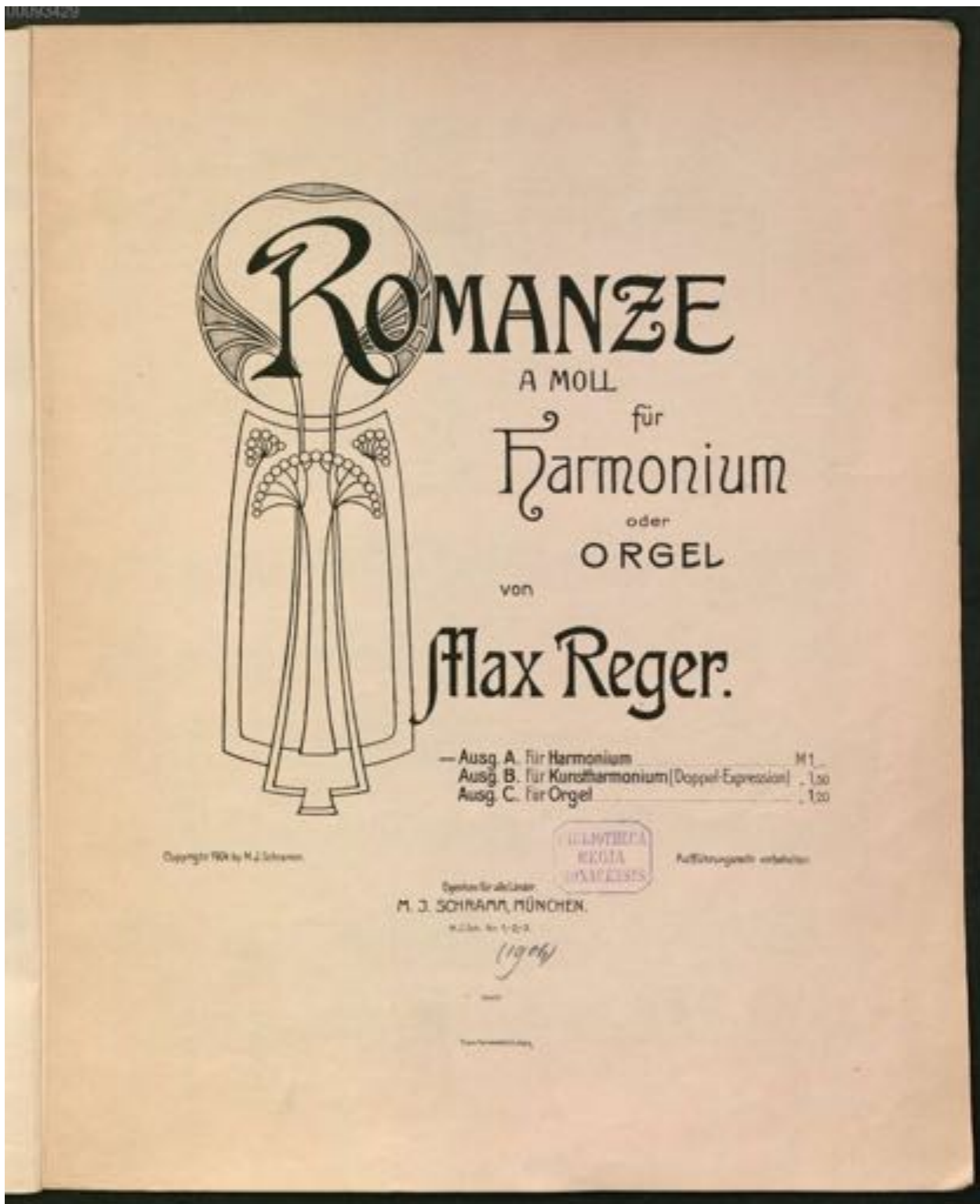
Abbildung 8: Titelblatt Romanze A-MOLL 43