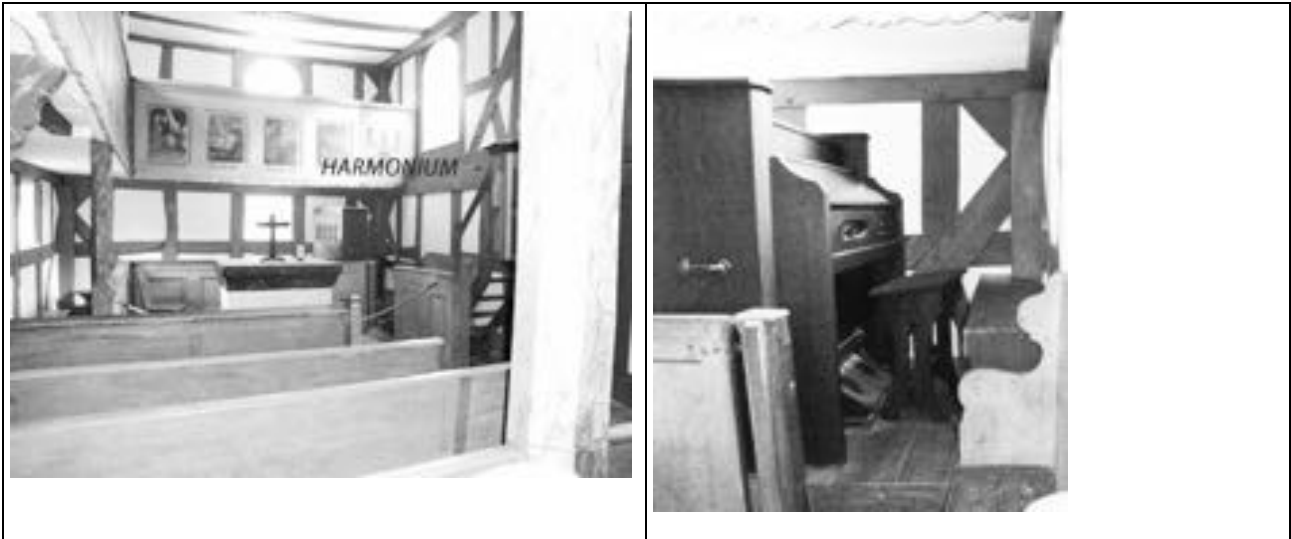
Abbildung 1: Bilder aus einer wiederaufgebauten Kirche aus dem 19. Jahrhundert im Hessenpark (Neu-Anspach/Hessen). – Das Harmonium steht direkt neben dem Altar (Hinweis im Bild)

Bisweilen wurde das Harmonium auch zusätzlich zur Orgel als „Chorinstrument“ genutzt – wie hier in einer Kirche im Wetteraukreis.