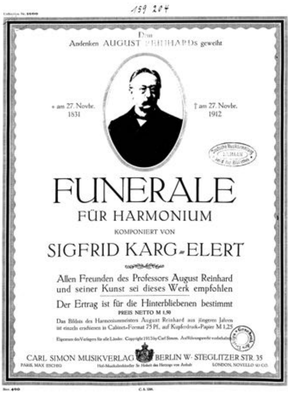
Abbildung 10: Titelblatt „Funerale“ 51